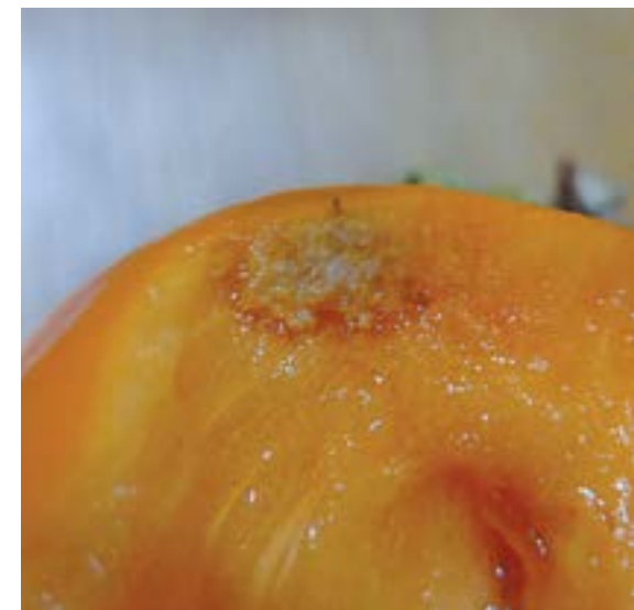
Рис. 12. Повреждение плодов хурмы коричнево-мраморным клопом