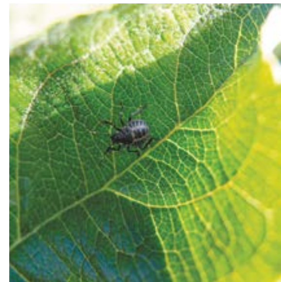
Рис. 6. Нимфа коричнево-мраморного клопа III возраста