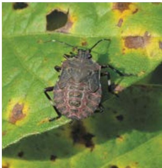
Рис. 8. Нимфа коричнево-мраморного клопа V возраста

Коричнево-мраморный клоп – теплолюбивое насекомое, развивается в пределах температур от +15 до +33 °С. При +15 °С могут развиваться только эмбрионы, тогда как отродившиеся личинки при этой температуре погибают, а температура +35 °С критична для всех стадий развития. При +33 °С выживает лишь 5% особей (Nielsen, 2008). Оптимальная температура воздуха, требуемая для нормального развития поколения вредителя – +18-25 °С. В зависимости от теплообеспеченности региона обита-