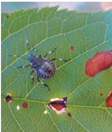
Рис. 7. Нимфа коричнево-мраморного клопа IV возраста