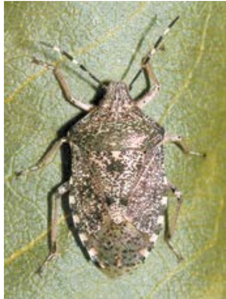
Рис. 21. Клоп Rharphigaster nebulosa