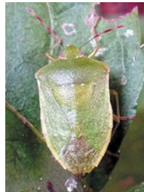
Рис. 18. Клоп Nezara viridula