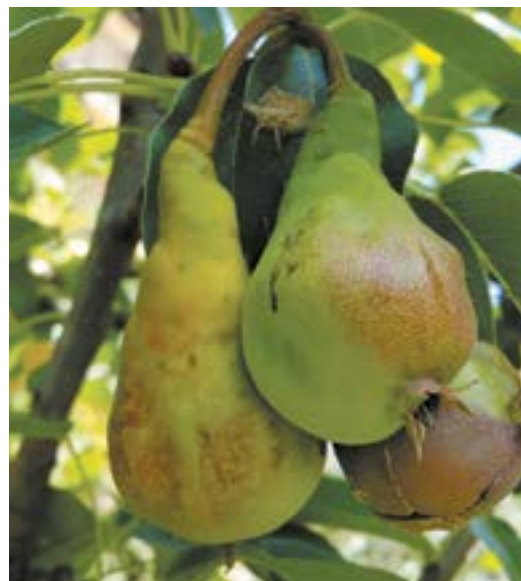
Рис. 9. Повреждение плодов груши коричнево-мраморным клопом

Коричнево-мраморный клоп в местах массового размножения также имеет статус «досягающего вредителя»: забираясь в жилища человека, он вызывает беспокойство; кроме того, клопы неприятно пахнут и могут вызывать аллергию у особенно чувствительных людей.