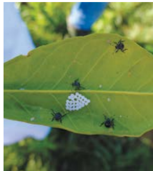
Рис. 5. Личинки (нимфы) коричнево-мраморного клопа II возраста