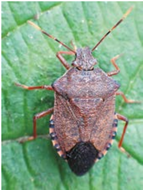
Рис. 20. Клоп Arma custos