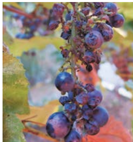
Рис. 11. Повреждение плодов винограда коричнево-мраморным клопом