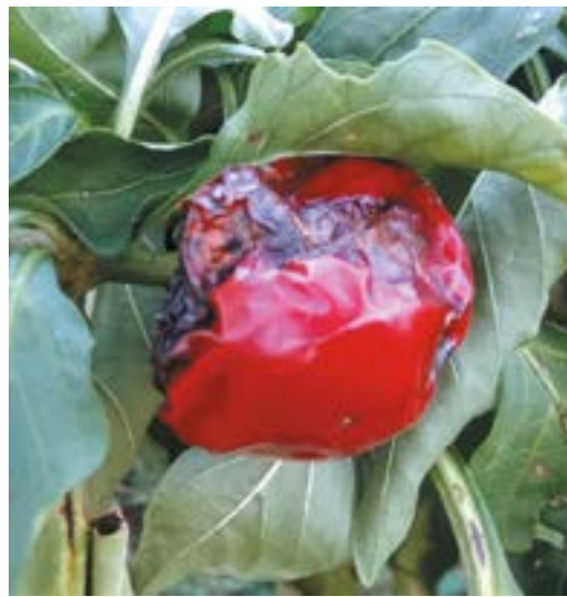
Рис. 15. Повреждение плодов сладкого перца коричнево-мраморным клопом