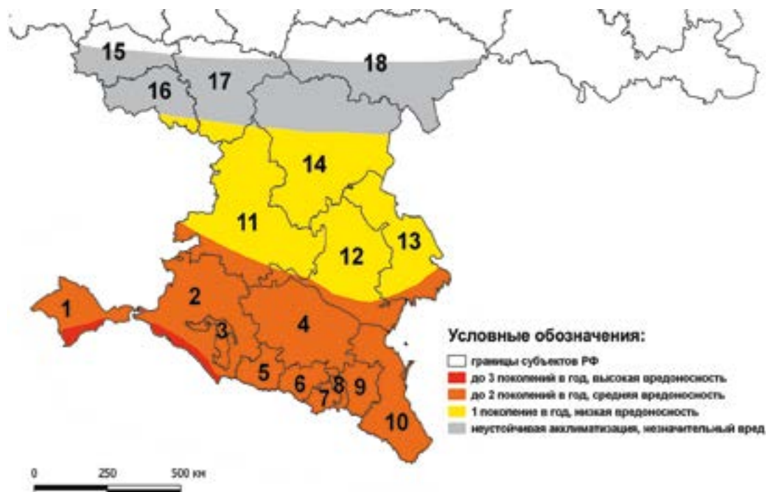
Рис. 1. Карта-схема потенциального ареала и зон вредоносности коричнево-мраморного клопа в Российской Федерации.