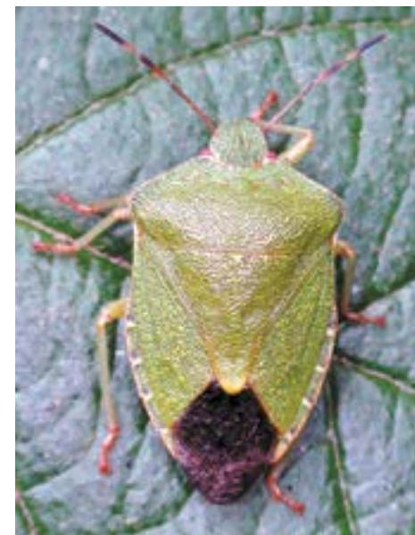
Рис. 17. Клоп Palomena prasina

Несколько труднее может быть различение коричнево-мраморного клопа с широко распространенным полифагом – клопом Rhaphigaster nebulosa Poda (рис. 21, 23), тяготеющим