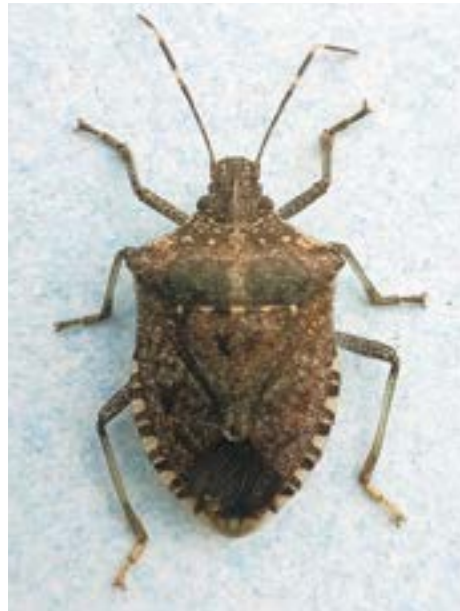
Рис. 22. Коричнево-мраморный клоп

к парковым древостоям и плодовым садам и также очень часто зимующим в различных помещениях. Но у этого вида верх тела имеет металлический отблеск, а перепоночка надкрылий – темный точечный орнамент, а не продольные пятна, как у коричнево-мраморного клопа (рис. 22).