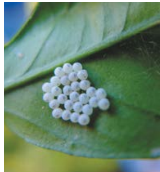
Рис. 3. Яйцекладка коричнево-мраморного клопа