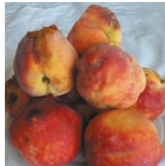
Рис. 10. Повреждение плодов персика коричнево-мраморным клопом