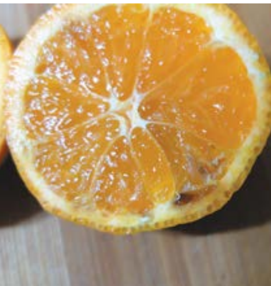
Рис. 13. Повреждение плодов мандарина (видны деформированная ткань и некроз, развивающийся в местах проколов) коричнево-мраморным клопом