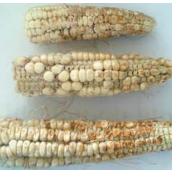
Рис. 14. Повреждение початков кукурузы коричнево-мраморным клопом