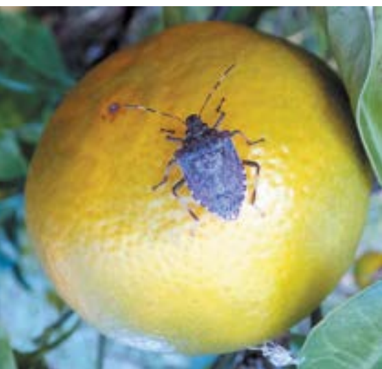
Рис. 2. Имаго коричнево-мраморного клопа

Яйца белые шаровидные, на нижней стороне листьев различных растений. Количество яиц в одной яйцекладке колеблется от 15 до 40 шт. (рис. 3). Личинки (нимфы) I возраста черноранжевые (рис. 4), II возраста – черные (рис. 5), затем светлеют (III-V возраста), отличаются неравномерной окраской и отсутствием крыльев. Сверху тела имеются оранжево-желтые пятна (Streito, 2015), по бокам груди – шипы (рис. 6-8).