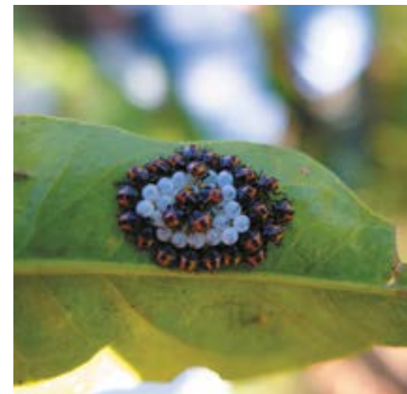
Рис. 4. Отрождающиеся личинки (нимфы) коричнево-мраморного клопа (I возраст)