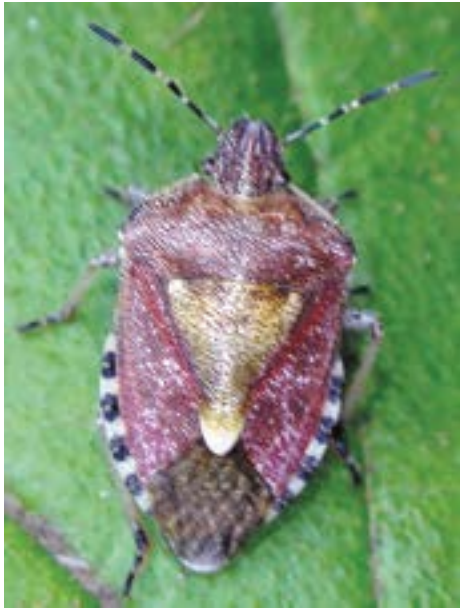
Рис. 19. Клоп Dolycoris baccarum